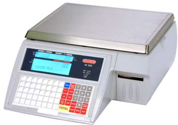
Systemwaage der neuen Generation